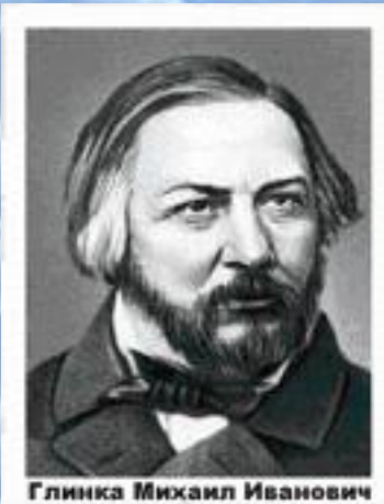
Глинка Михаил Иванович

1833 год. Новая мелодия и новые слова в гимне «Боже царя храни».