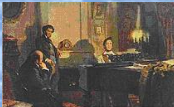
А.С. Пушкин и В.А. Жуковский у М.И. Глинки Художник В. Артамонов

В отличие от гербов и флагов, которые были символами государств ещё в глубокой древности, гимны, как государственные символы. Появились сравнительно недавно.