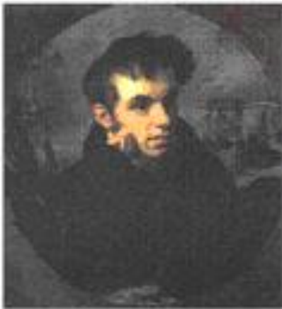
Василий Жуковский Гравюра с портрета Кипренского

Первым официальным государственным гимном России можно считать гимн, написанный в 1815 году поэтом Василием Жуковским на музыку британского гимна. Российский император Александр Первый в 1816 году одобрил стихи написанные Жуковским и повелел всегда исполнять этот гимн во время встреч императора.