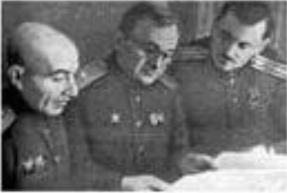
Авторы гимна СССР (слева направо): писатель Г.А. Эль-Регистан, композитор А.В. Александров и поэт С.В. Михалков