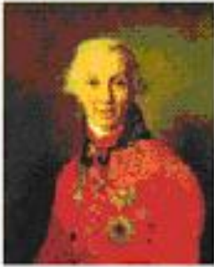
Гавриил Державин Художник В.Боровиковский 1811 г.

Первым гимном России (правда, неофициальным) можно считать марш «Гром победы раздавайся». Этот марш в 1790 г. был написан поэтом Гаврилой Державиным и композитором Иосифом Козловским в честь героического взятия русскими войсками (под командованием великого полководца Александра Суворова) неприступной турецкой крепости Измаил.